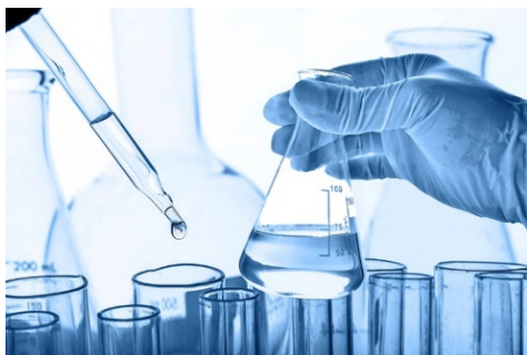
Bild 1: Forschungsförderung in der DGR 2 Z

Die zur Förderung eingereichten Anträge werden durch zwei Gutachter beurteilt. Damit erfolgt die Vergabe unabhängig und mit hohem wissenschaftlichem Anspruch. Die Unterlagen sind in digitaler Form bei der Geschäftsstelle der DGR 2 Z als PDF-Dateien einzureichen. Informationen zur Antragstellung können der Homepage der DGR 2 Z unter www.dgr2z.de/zahn-aerzte/foerderung entnommen werden. Einsendeschluss ist der 15. Juli 2021.