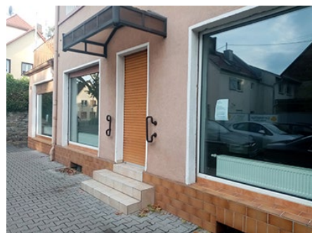
Außenansicht der Geschäftsstelle